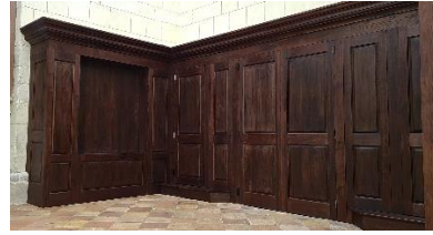
Boiseries de l'Eglise du Mas d'Agenais (47) qui va recevoir la vitrine protégeant le Rembrandt