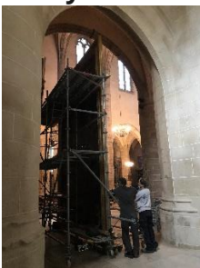
Repose d'un tableau monumental dans une zone très étroite

Envoyez CV + lettre de motivation : contact@malbrelconservation.fr